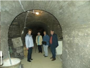
Im alten Weinkeller