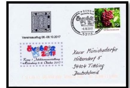
Sonderstempel der Deutschen Post