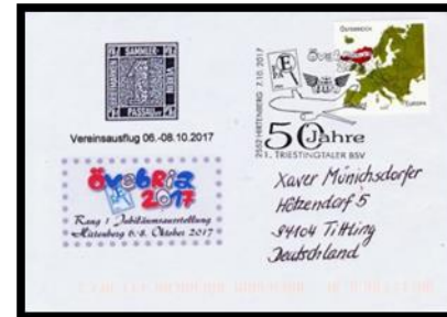
Sonderstempel Triestingtaler BSV

Der nächste Tag stand ganz zur Verfügung für die Internationale Briefmarken-Ausstellung in Hirtenberg. Die mitreisenden Damen erkundeten zu Fuß die Stadt, während alle anderen Mitglieder sich für die Ausstellung entschieden haben. Es gab außerdem viele Möglichkeiten sich Belege mit Sonderstempeln zu kaufen oder sich echt gelaufene Belege zuzusenden. Hier einige der möglichen Sonderstempel.