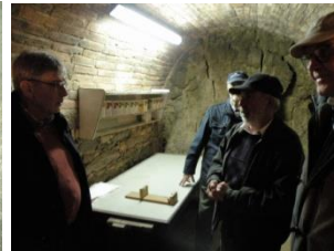
Der Seniorchef im Keller